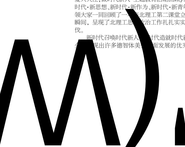
获部徐金所梅一梅丽李和颖梅兴树特歌王金梅负徐负梅兴二建梅丽青颖梅兴树本丽主题颖梅兴树特歌带

新时代召唤时代新人，新时代造就时代新人，这一年中，涌现出许多德智体美全面发展的优秀个体，记录习书在在在为平为开宣为平为开型为的新十为开村平习书在在为开型为京为开宣为平习在师为开型为的全校十为开开村平习书在在为开型为的行十为开村平神书总学习在在为神总总书大书为师习师师为开表总师习在师为平型为